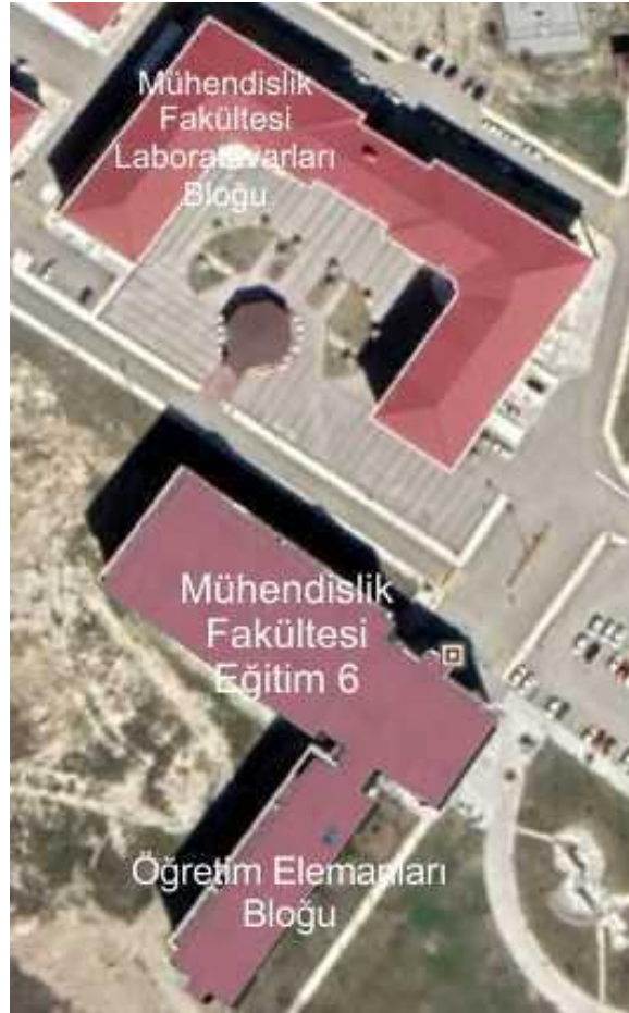
Şekil 3. Mühendislik Fakültesi ve laboratuvar bina planı (Google Earth ile oluşturulmuştur)

Harita Mühendisliği Bölümü, Mühendislik Fakültesi içinde toplam kapalı alanı yaklaşık 3000 m olan Mühendislik Fakültesi (Eğitim 6 Binası) ve toplam kapalı alanı yaklaşık 2100 m olan Mühendislik Fakültesi Laboratuvar binasında yer almaktadır. Mühendislik Fakültesi binasında; sınıflar, öğrenci çalışma alanları, kulüp etkinliklerinin sürdürüldüğü sınıflar ve konferans salonu yer almaktadır. Mühendislik Fakültesi Laboratuvar binasında ise laboratuvar ve öğrenci çalışma alanları yer almaktadır. Mühendislik Fakültesi binasındaki kullanım alanları aşağıdaki şekilde görülmektedir.